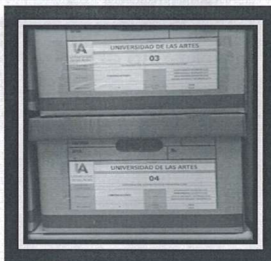
Figura 4: Contenedores o Cajas etiquetados

Quedando en la cajas tal como se logra ver en la siguiente imagen: