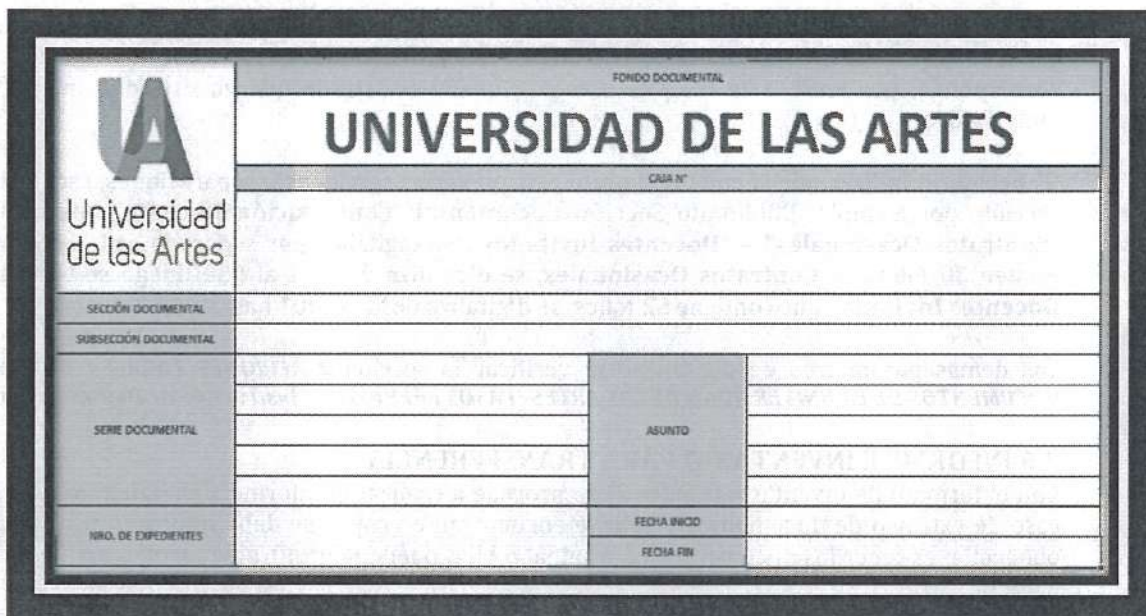
Figura 3: Formato de Etiqueta para Contenedores o Cajas

Los biblioratos a transferirse se van guardando en las cajas de retención (cartones que proporciona la Dirección de Gestión Documental y Archivo a las Unidades); y en cada caja se detalla los biblioratos que se encuentran adentro archivados; bajo el siguiente rótulo (Figura 3):