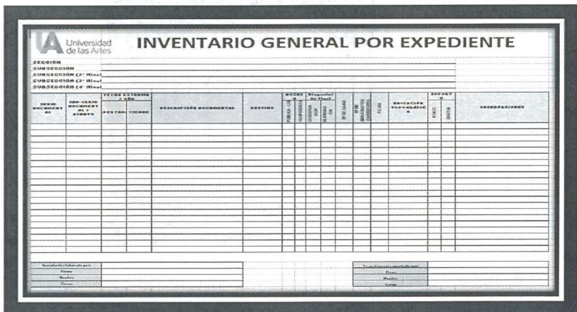
Figura 2: Formato de Inventario General por Expediente

Este informe va destinado para el titular/encargado de DIGEDA y con copia a su propia autoridad. En este punto existe un paso, previo a la entrega del informe, antes de imprimir este, la Dirección de Gestión Documental y Archivo contrastará que el contenido del informe y de las cajas guarden el mismo contenido.